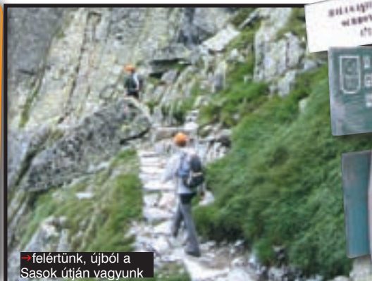
↑ felértünk, újból a Sasok útján vagyunk

TÚRAAJÁNLAT Sasút (Orla Perc) /Lengyel Tátra Via ferrata Lengyelországban a Wolf Outdoor Via ferrata csapatával! Időpont: 2006. július 20–23. További információk: www.viaferrata.hu