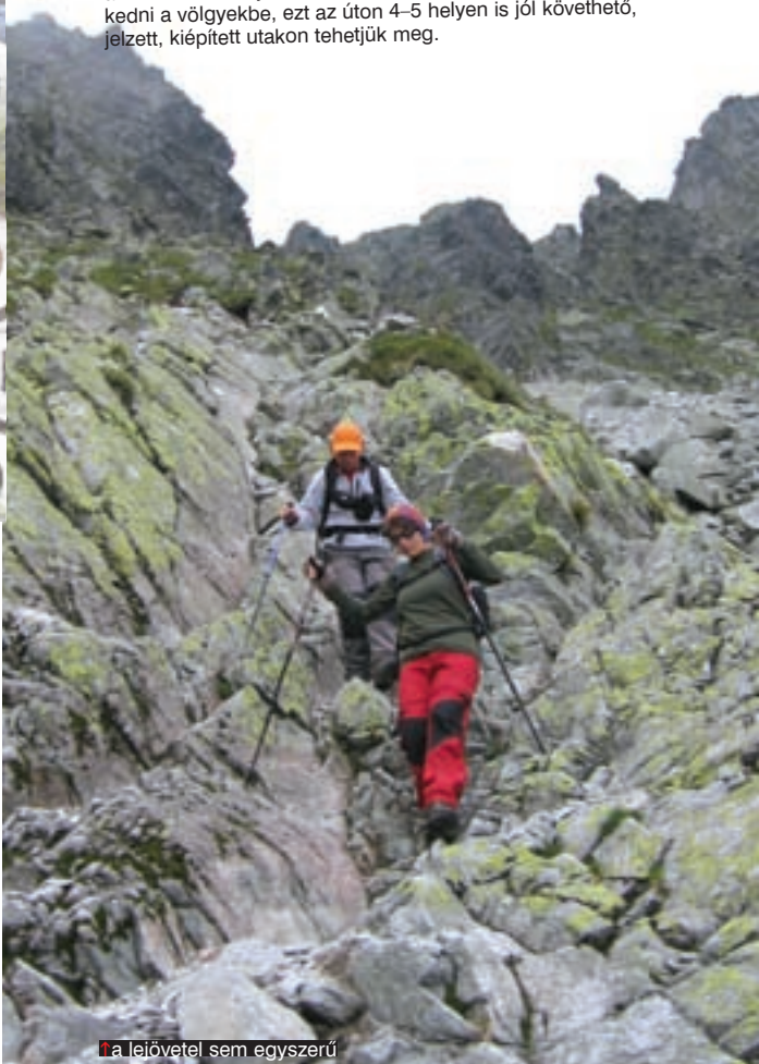
↑ a lejövetel sem egyszerű

Megjegyzés: érdemes igen korán elindulni (akkor még kevesebb a turista), mivel jó időjárás esetén a nagy tömeg a láncoknál történő várakozási időt akár több órával is megnövelheti. Rossz idő esetén ugyanazok a szabályok lépnek életbe, mint az Alpokban történő ferratázásnál: azonnal meg kell szakítani az utat és le kell jönni! A lehető leggyorsabban le kell ereszkedni a völgyekbe, ezt az úton 4–5 helyen is jól követhető, jelzett, kiépített utakon tehetjük meg.