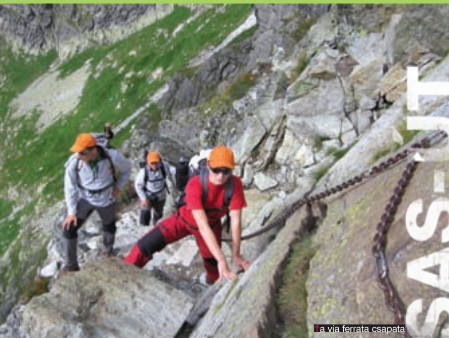
↑ a via ferrata csapata