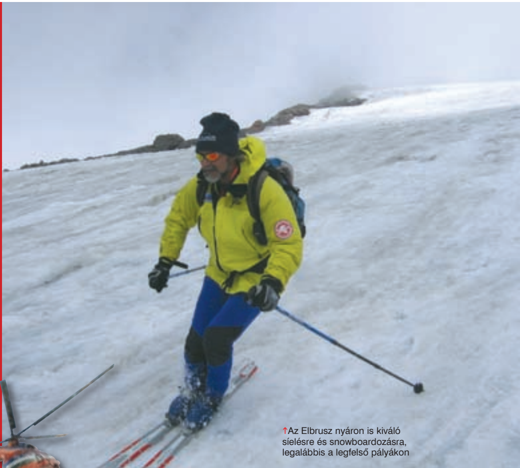
↑Az Elbrusz nyáron is kiváló síelésre és snowboardozásra, legalábbis a legfelső pályákon

Az Elbruszon nyáron is lehet sízni, illetve snowboardozni, legalábbis a felső pályákon. Egy napra érvényes síbérlet felnőtteknek 210 rubel, gyermekeknek (12 év alatt) 105 rubel. Helikopteres sízésre is van lehetőség, egy helikopter bérlése egy órára, húsz személy részére (túravező biztosított) 1150 dollár. (Lásd korábbi számunkban Kaukázus helisi 2006/1. szám.)