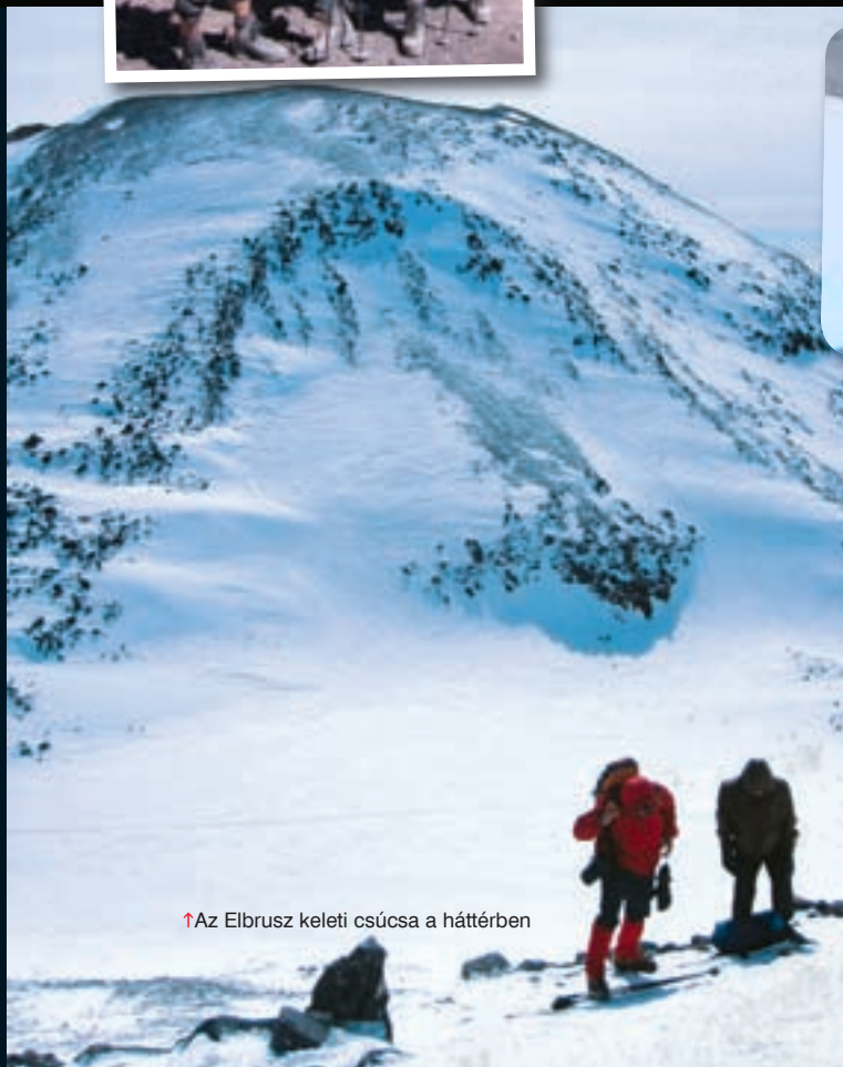
↑Az Elbrusz keleti csúcsa a háttérben

KAUKÁZUS: ÉNY–DK-i irányban húzódó, számos gerincből álló, gyúrt magas hegység a Fekete-tenger és a Kaszpi-tenger között. Hossza 1280 km, szélessége 100–225 km, területe kb. 84 000 km 2 . Felosztják Nagy-Kaukázusra és Kis-Kaukázusra. Geológiai felépítése igen változatos. Ásványkincsekben gazdag.