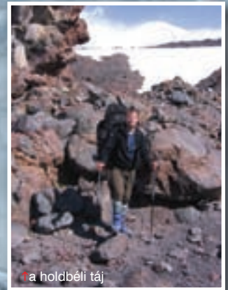
a holdbéli táj