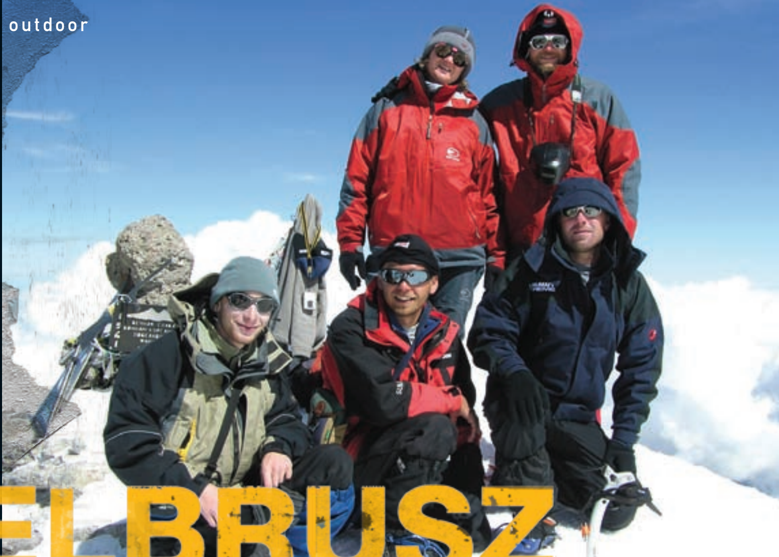
↑ A csúcson