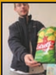
↑Zoli a kapros chipsszel

Külföldi söröket nem láttam, de a helyi sörök igen jók voltak. A nyugati kultúra is érezeti hatását a chips megjelenésével, ami azonban kapros ízesítésben összetéveszthetetlen egyedí ízvilágot tükröz.